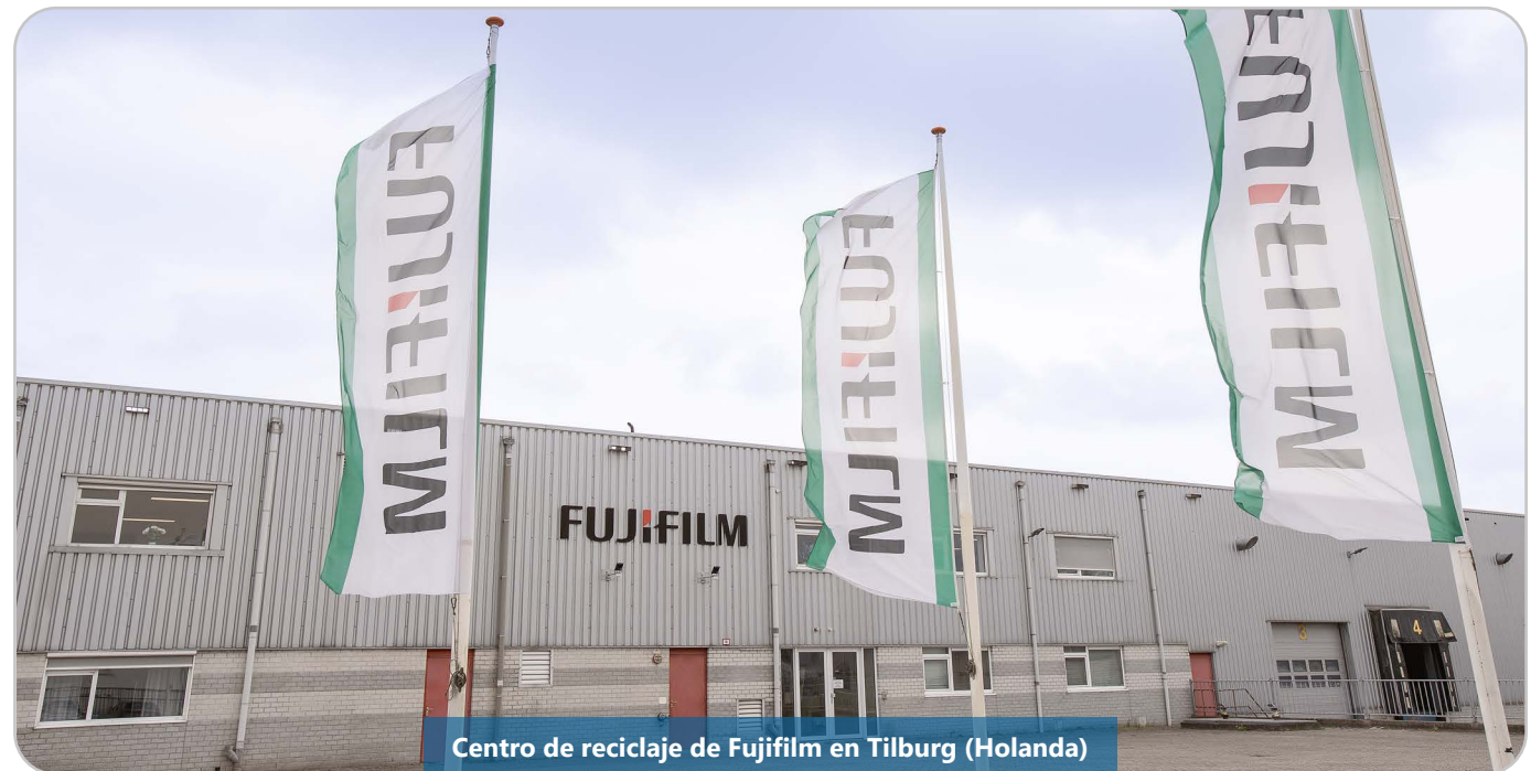
Centro de reciclaje de Fujifilm en Tilburg (Holanda)

La nueva gama de Fujifilm genera “entornos de trabajo seguros donde los documentos son confidenciales y solo accesibles para quien los crea”. Además, su tecnología LED reduce significativamente el consumo de energía y el impacto